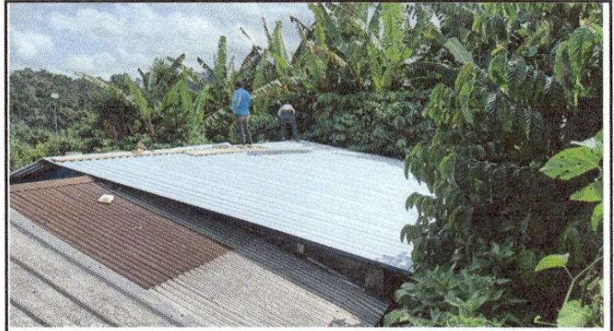
CUBIERTA DE LAMINA. Módulo 2 Aula 1