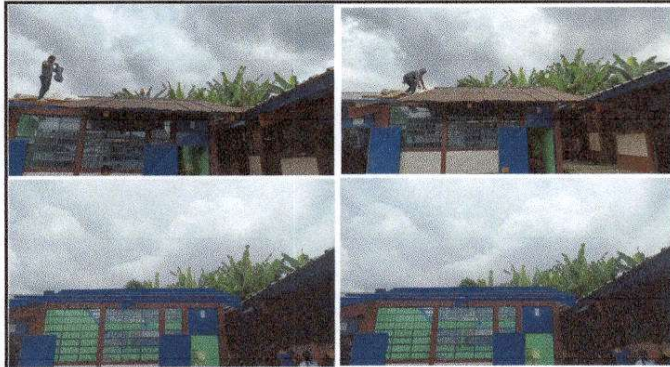
CUBIERTA DE LAMINA. Módulo 1 Aula 1