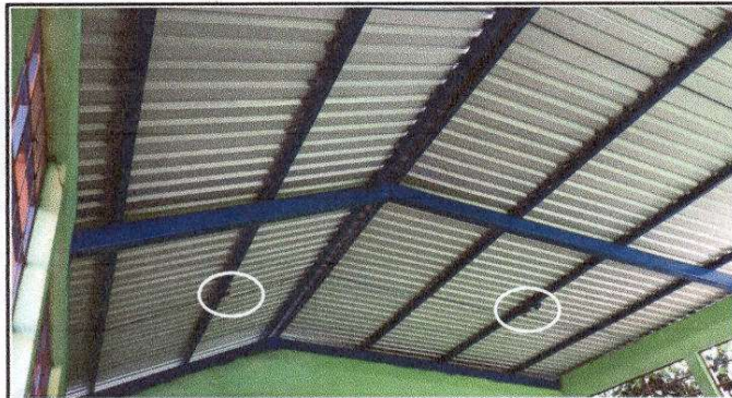
REPARACION DEL SISTEMA ELECTRICO. Aula 1 Módulo 2