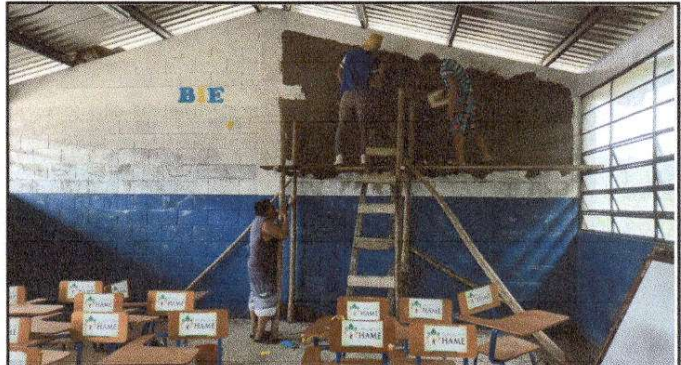
REPARACION DE SISTEMA ELECTRICO Y REPELLO DE MURO. Aula 2 Módulo 1