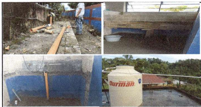
SANITARIO DE DAMAS. Sustitución de inodoros (tazas), lavamos, piso, drenaje, vidrios, depósito de agua, mantenimiento de puertas.